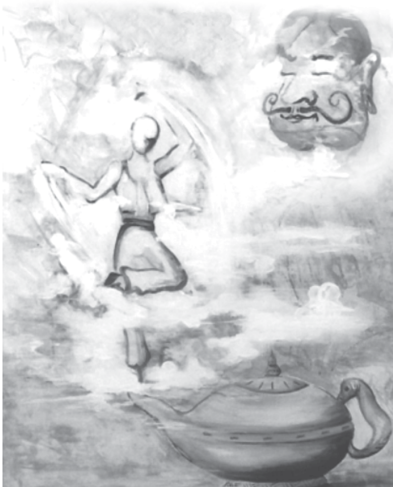
Figura 7.1: Mi genio interno