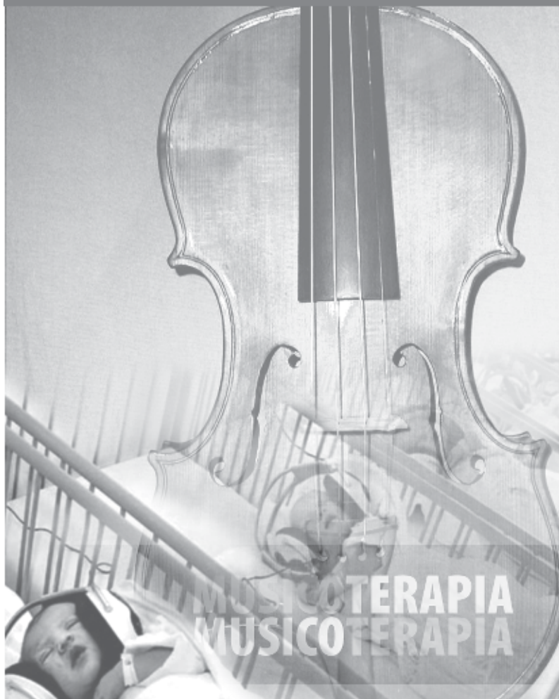
Figura 7.2: Música-terapia. En la figura se observa niños prematuros escuchando música con audífonos. La melodía que escuchan es la del corazón de su madre, la voz de su padre y música seleccionada por los progenitores, cuando el feto estaba en el vientre de su madre. Estos niños disminuyeron el tiempo de estadía en el retén al compararlos con el grupo control.